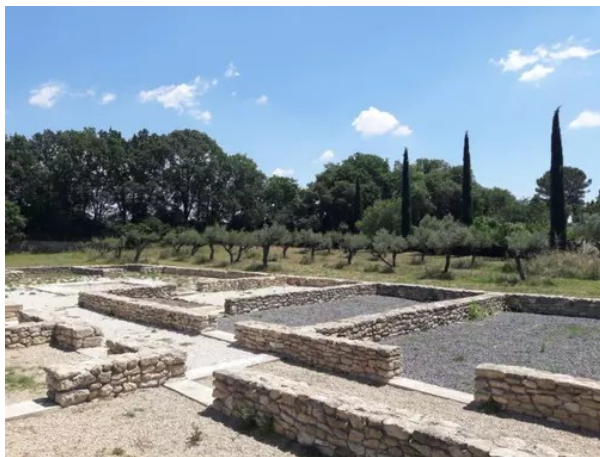
Villevieille – site archéologique