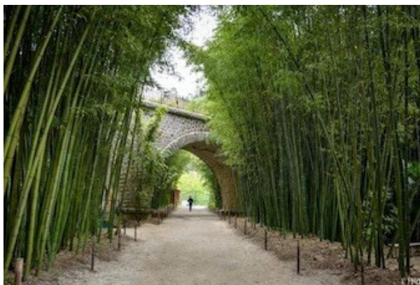
Anduze - Bamboueraie